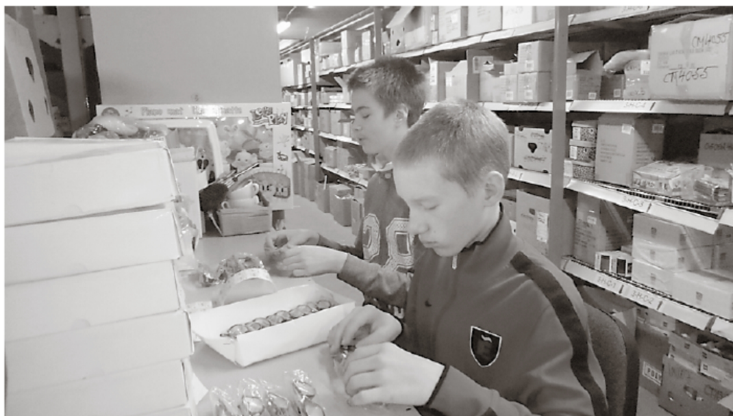
Võru Järve Kooli õpilased tööharrjutusel jaelaos.

Projektis on olulisel kohal praktiliste kogemuste