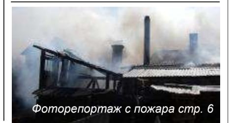
Фоторепортаж с пожара стр. 6